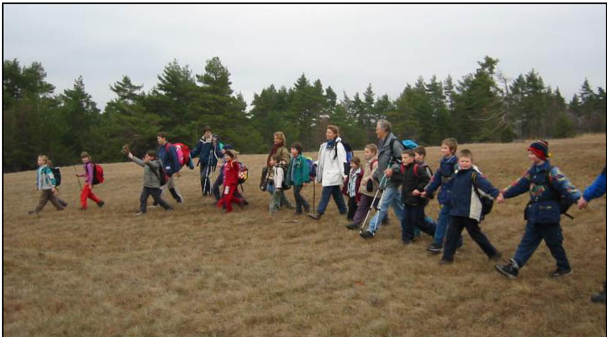
Izlet mladinskega odseka na Sveto Trojico (Lonica), 22. 11. 2003.